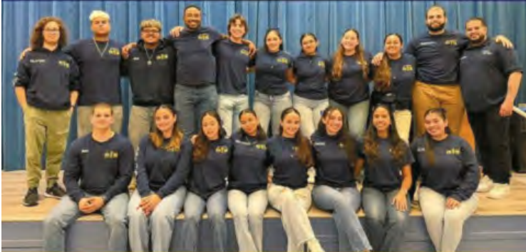
MOTHER OF OUR REDEEMER LEADERSHIP TEAM 2024